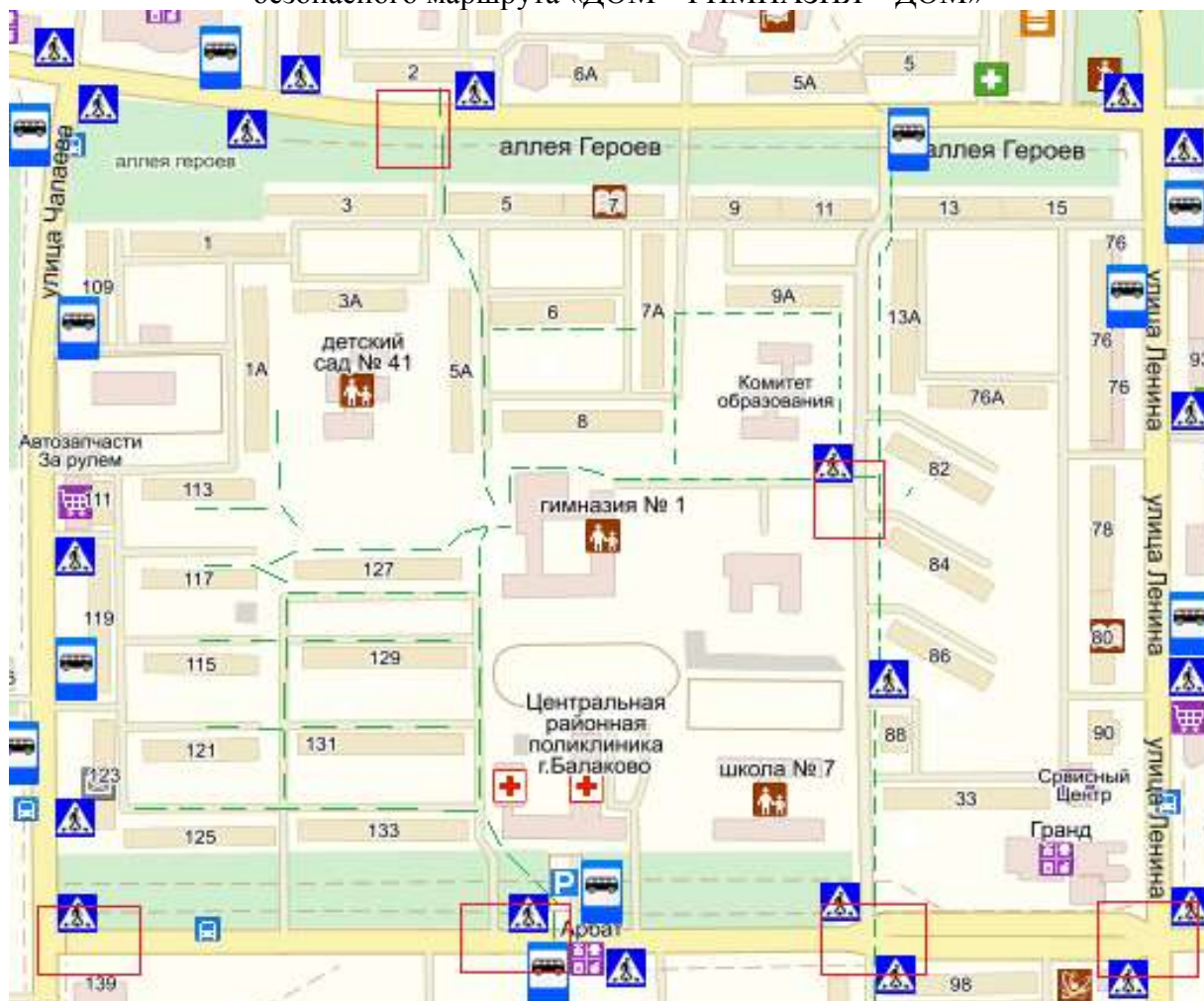
СХЕМА безопасного маршрута «ДОМ – ГИМНАЗИЯ – ДОМ»